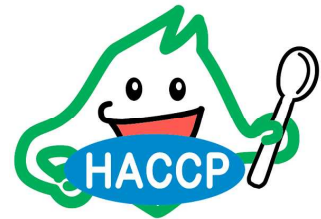
認証マーク 「ハサップくん」

食品の製造・加工・調理販売施設において、HACCPによる自主衛生管理が適切に行われているかどうかを審査し、道が定める基準に達しているものを認証する制度です。認証された食品には、認証マークを表示することができるほか、「北海道HACCP」webページや認証食品のガイドブックで施設名、食品等を紹介しています。